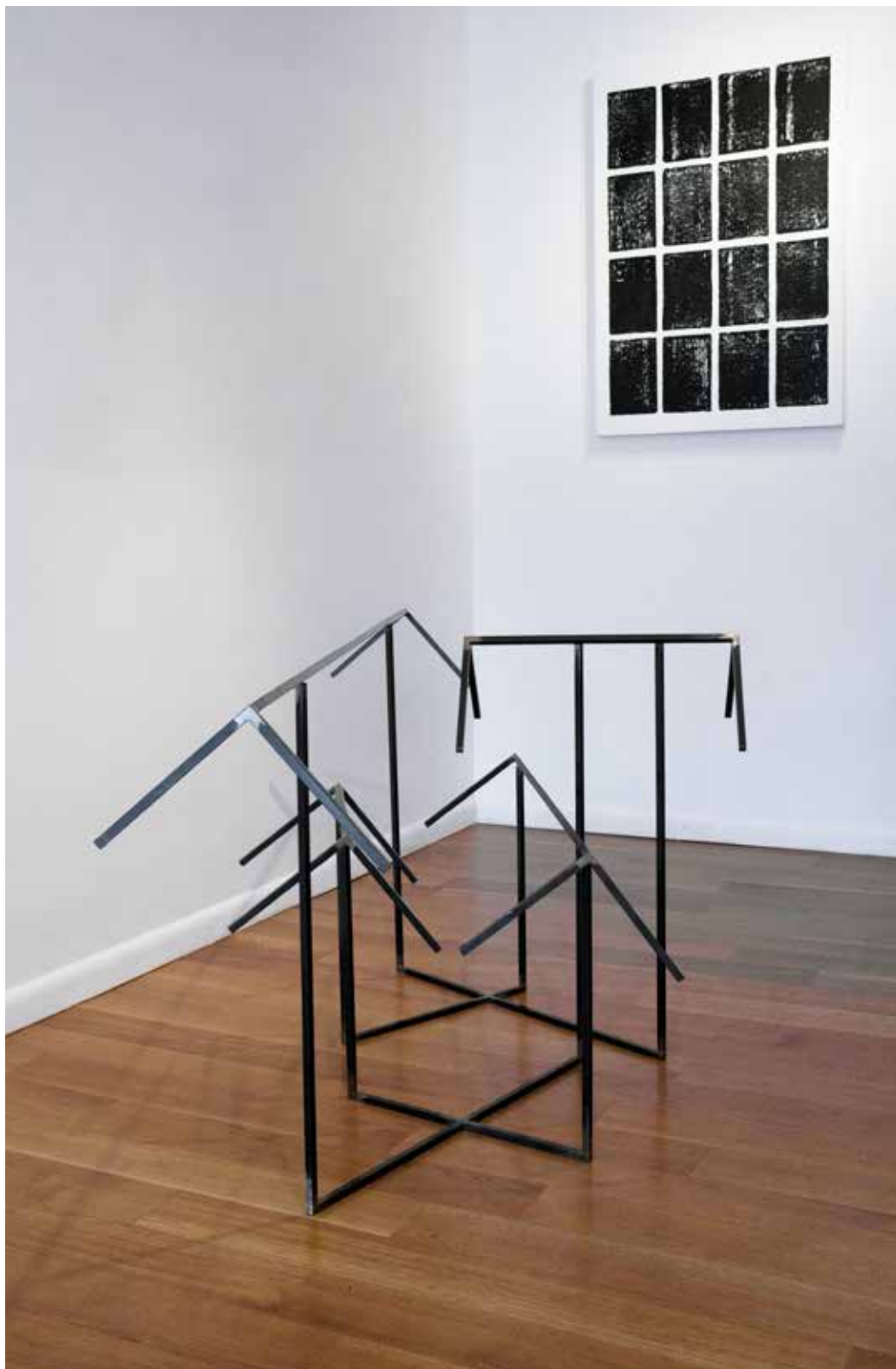
Animal 2015 aço 1020 com resina sintética steel 82 x 114 x 203cm