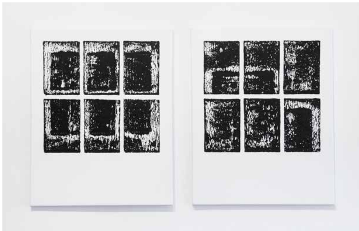
Fenestra #38 2015 acrílica sobre tela acrylic on canvas 50 x 40cm

O título da mostra também faz referência ao espaço mais íntimo de um artista: seu ateliê. O ateliê como espaço vazio, como lugar de experiência. Tanto Animal (2015) quanto Fenestra (2015) deixam o processo de realização à mostra. Aqui, o processo é a obra. A escultura cinética que ocupa o centro da galeria é feita de peças, módulos. É um trabalho que parte de uma unidade simples, que, multiplicada, combinada e recombinada pelo artista, revela sua complexidade em diferentes possibilidades de estrutura final.