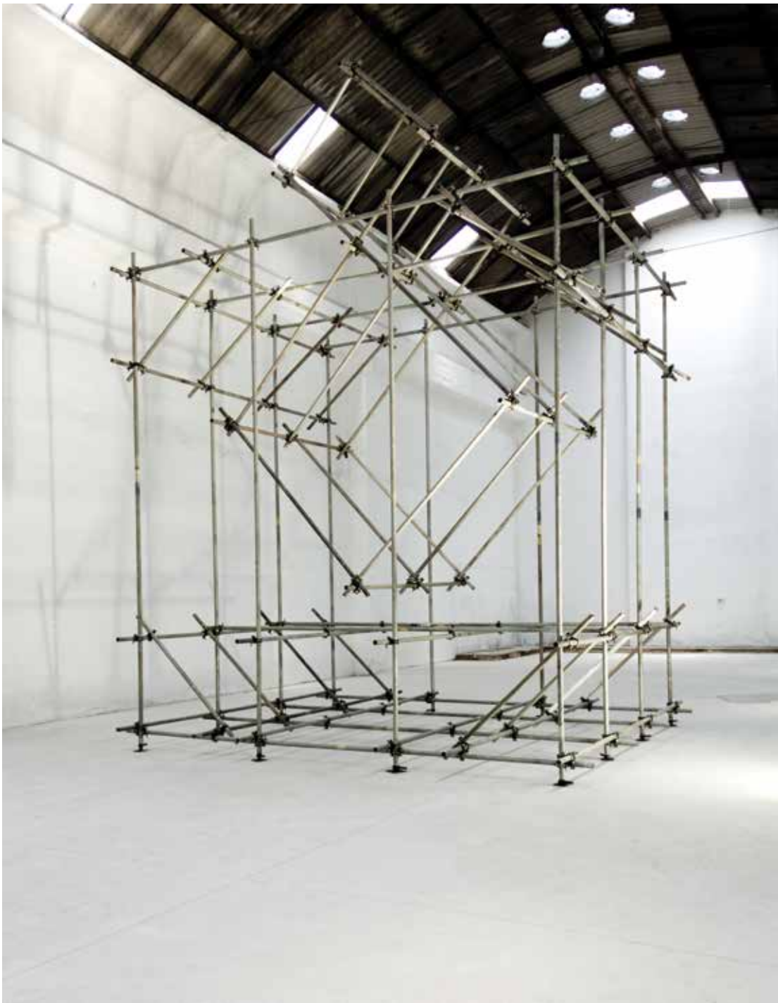
Balanço Maré 1 (para Bela e Lia) 2011 galvanized pipes and clamps tubos de aço galvanizado e braçadeiras 670 x 500 x 400 cm