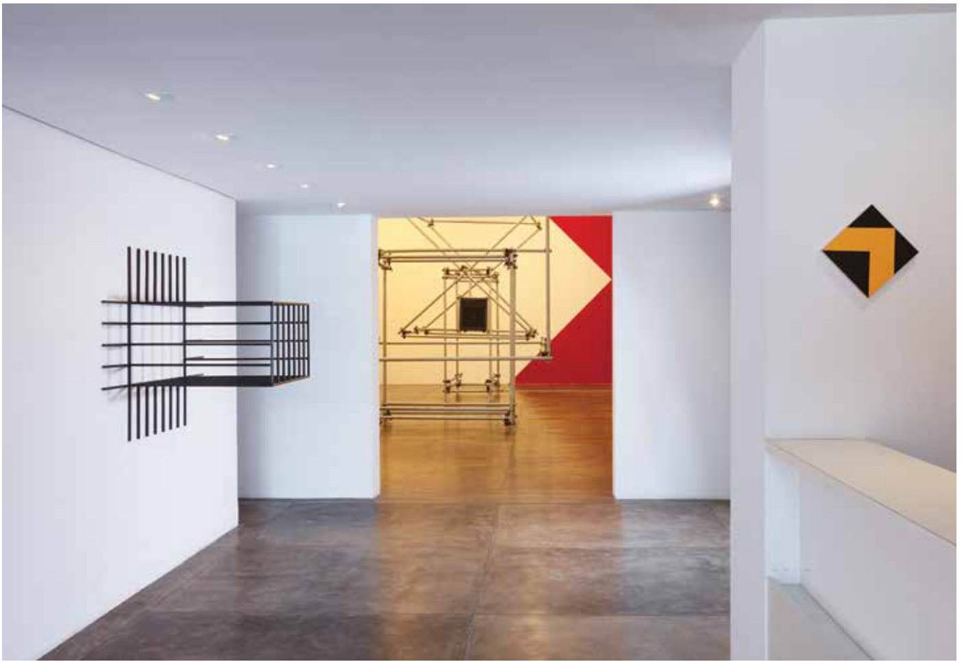
Partial view of the exhibition Vista parcial da exposição