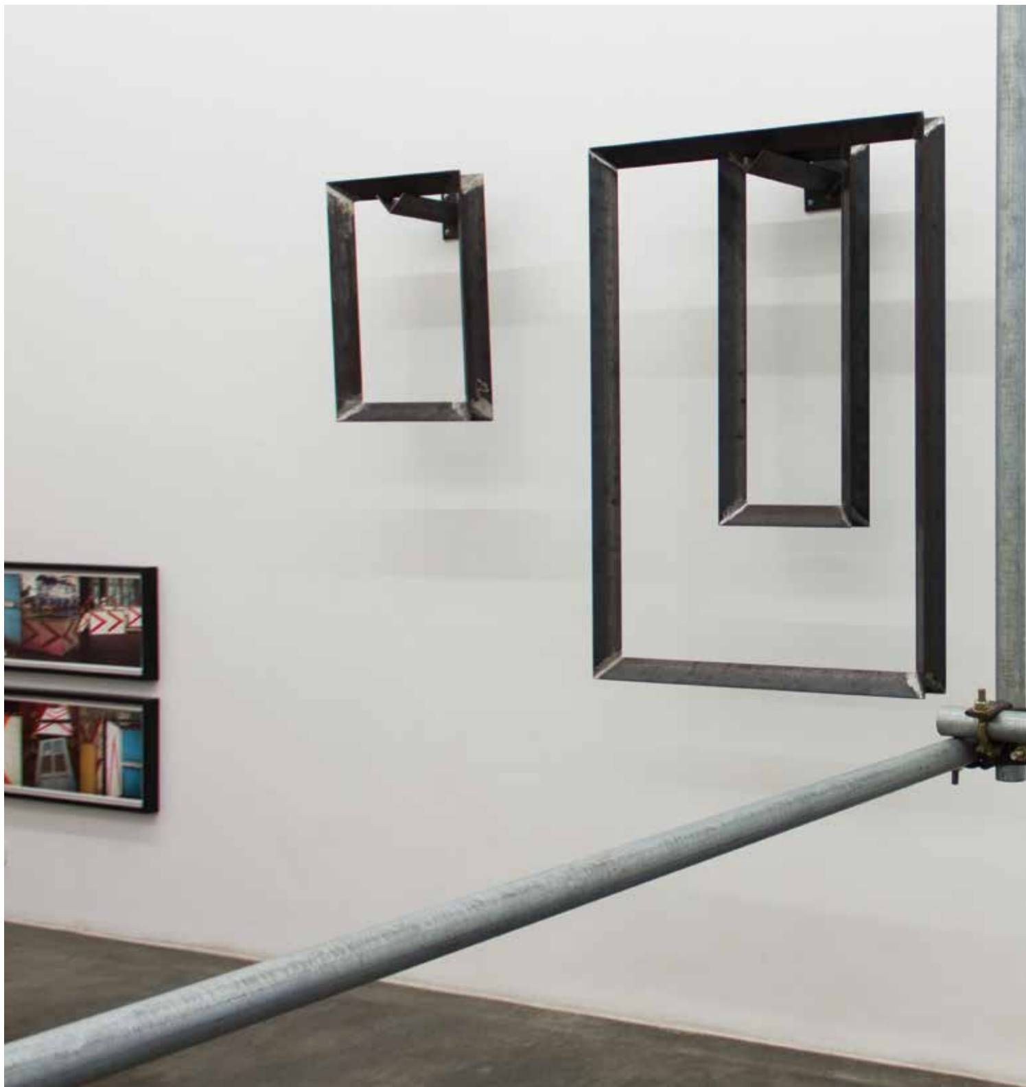
Cantoneira # 1 2014 steel and synthetic resin aço 1020 com resina sintética 50 x 50 x 30 cm