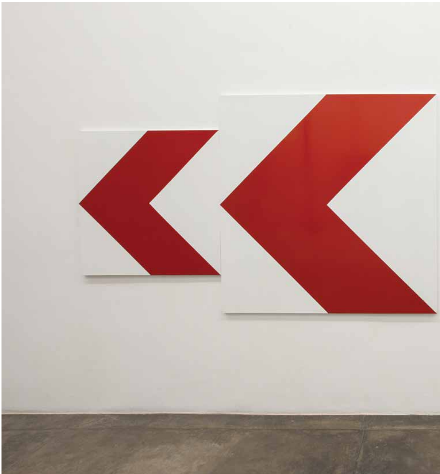
Setas (diptico) Arrows (diptych) 2014 enamel on aluminum esmalte sintético sobre chapa de alumínio 150 x 250 cm