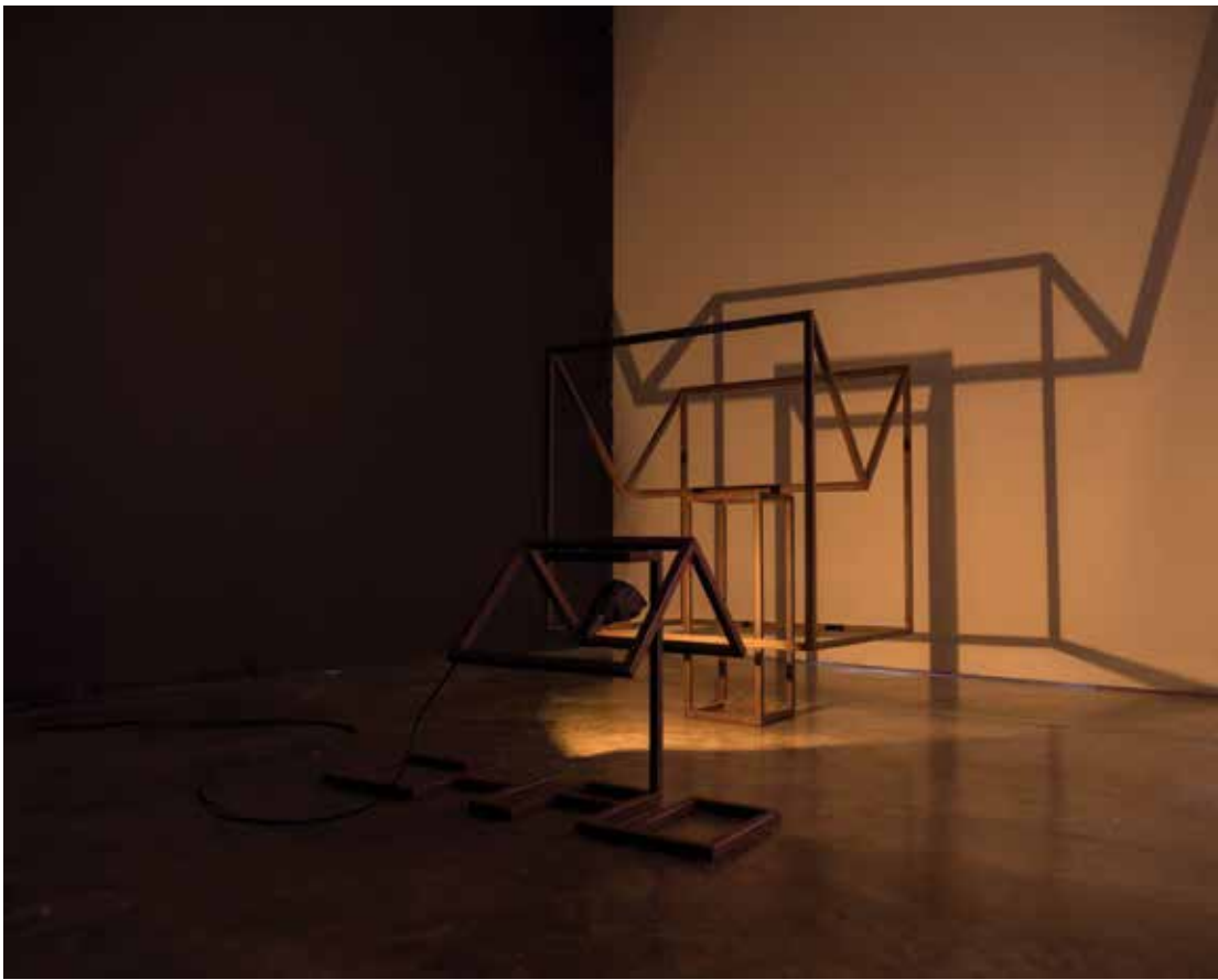
Sombra/Chão Shadow/Floor 2012 steel and lamps aço 1020 e lâmpada variable dimensions dimensões variáveis