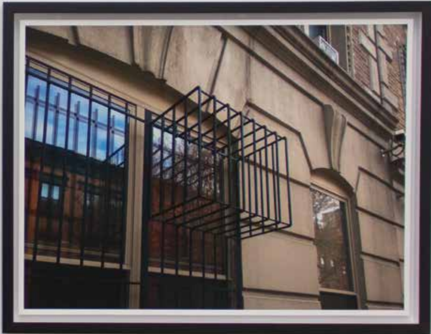
Grade/Ar 2013 mineral pigment on cotton paper (Hahnemühle Photo Rag 308) pigmento mineral sobre papel de algodão (Hahnemühle Photo Rag 308) 54 x 71 cm