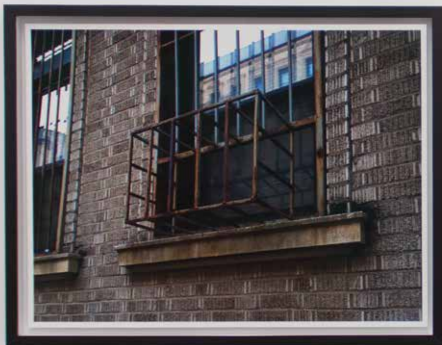
Grade/Ar #2 2013 mineral pigment on cotton paper (Hahnemühle Photo Rag 308) pigmento mineral sobre papel de algodão (Hahnemühle Photo Rag 308) 54 x 71 cm