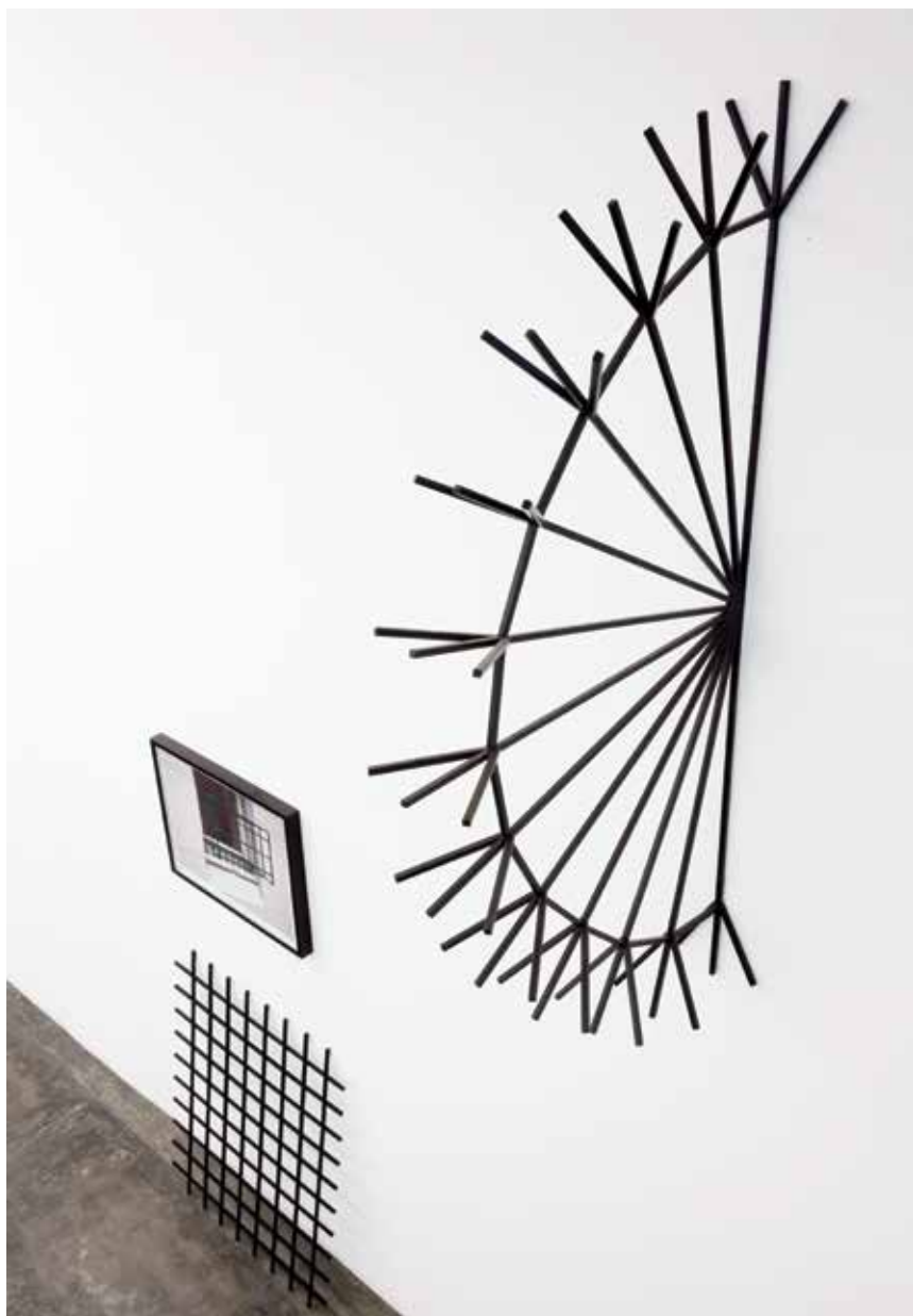
Grade Marcuse 2014 painted steel aço 1020 com pintura eletrostática 190 x 23 x 92,5 cm