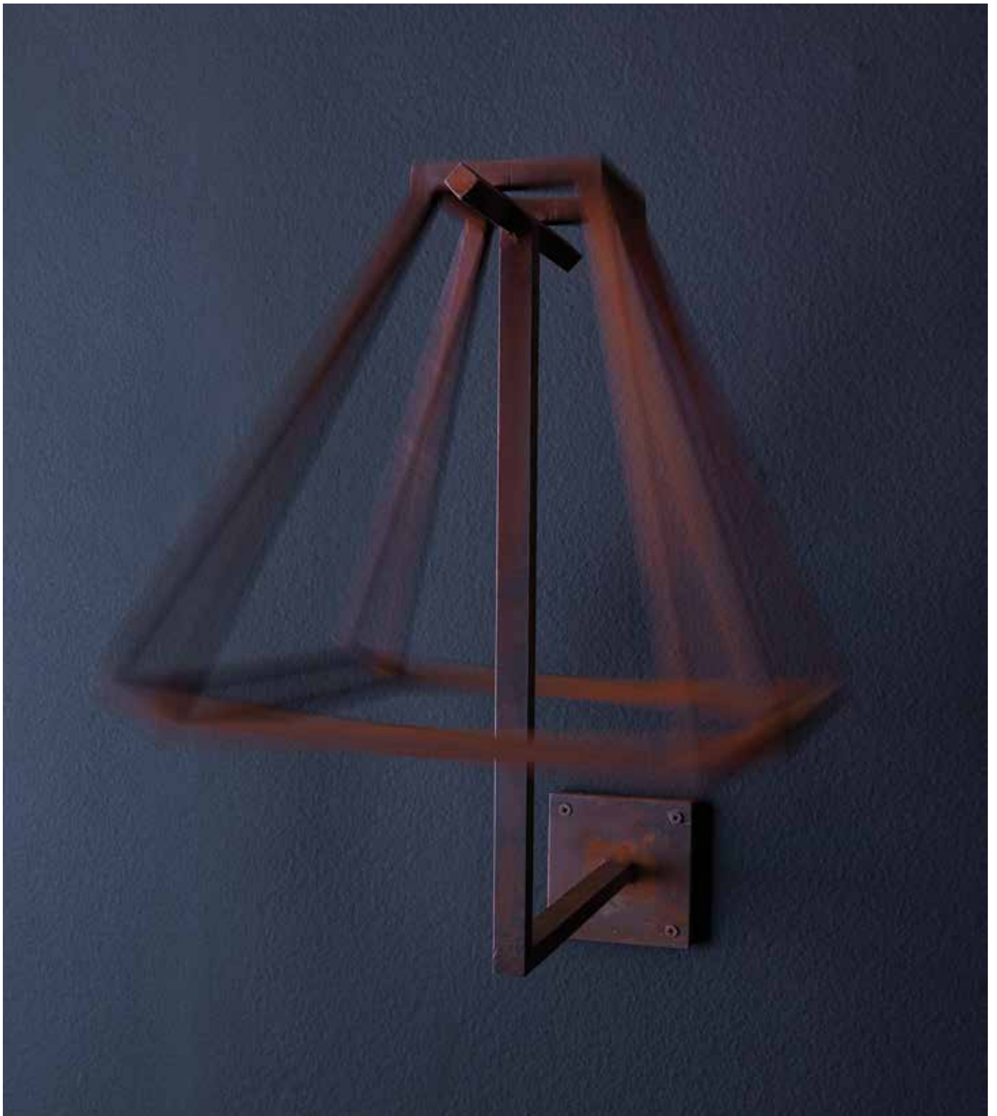
Mais luz More light 2013 Corten steel Aço corten 49,5 x 41 x 30 cm