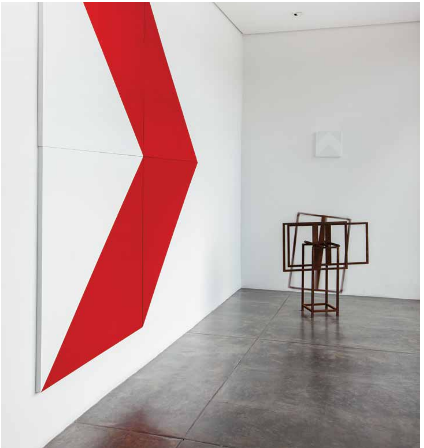
Seta de rua (4 isosceles) # 2 Street arrow (4 isosceles) #2 2014 enamel on aluminum esmalte sintético sobre chapa de alumínio 250 x 250 cm