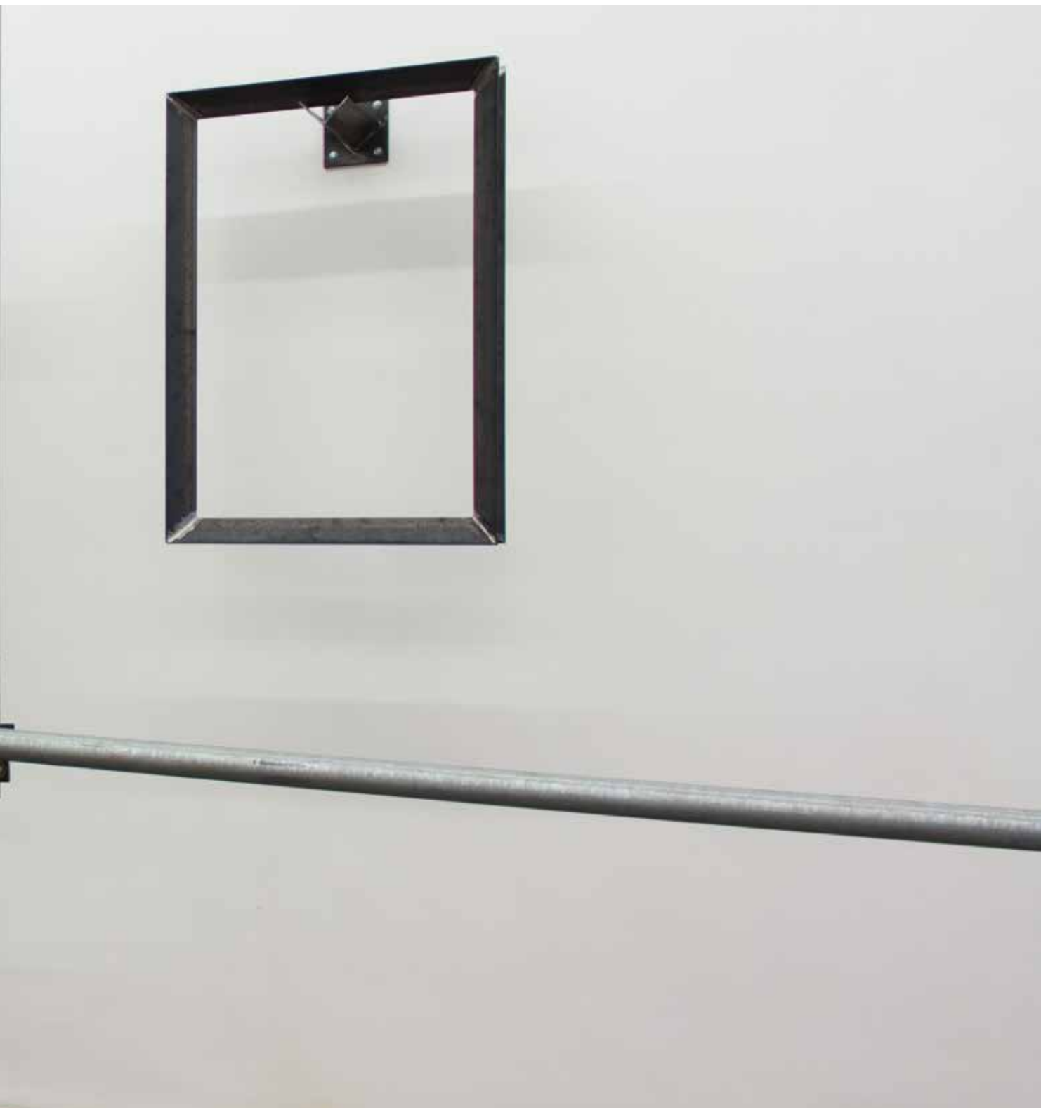
Cantoneira # 3 2014 steel and synthetic resin aço 1020 com resina sintética 100 x 70 x 30 cm